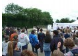
chez Alan Le Gall Domaine de Gauchoux