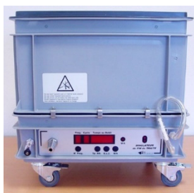
Simulateur de Fin de Traite (SFT) (© Atauce)

Vignette apposée à l'issue d'un Dépos'Traite®