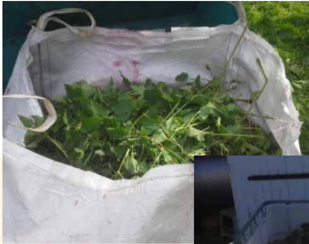
La matière première