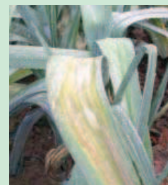
Utilisation du cuivre comme action fongicide contre le mildiou