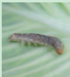
Utilisation de la bactérie Bacillus thuringiensis contre les larves de lépidoptères