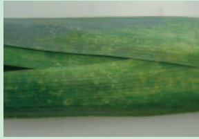
Dégâts du thrips sur poireau