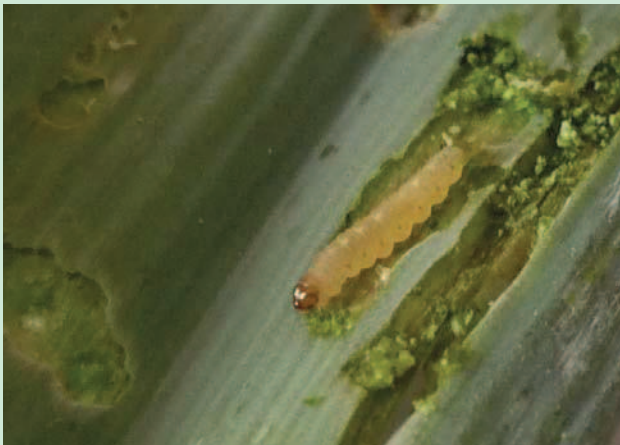
Dégâts de la teigne sur poireau

Sa faible rémanence et son faible spectre d'action ne le rendent efficace que sur les stades larvaires