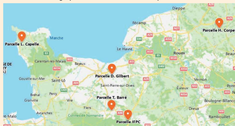
FIGURE 1 : Cartographie de la localisation des 5 parcelles d'essai.