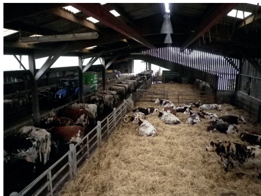
Bâtiment vaches laitières de La Blanche Maison