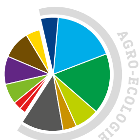
Répartition du financement CASDAR par AE sur 2014-2020

Un programme qui représente en moyenne annuelle sur la période 2014-2020, 4,2 M€ de dépenses. Financé à hauteur de 2.2 M€ de CASDAR, il a mobilisé en moyenne 44 ETP par an (120 collaborateurs).